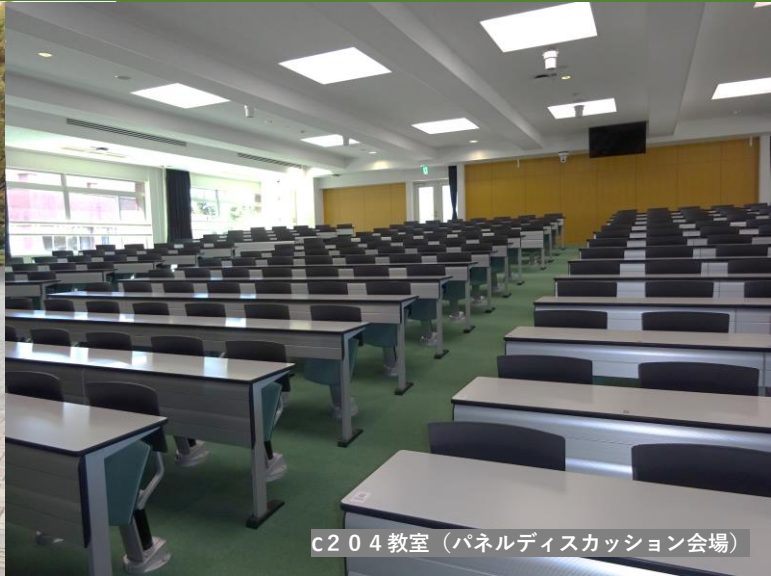
C204教室（パネルディスカッション会場）