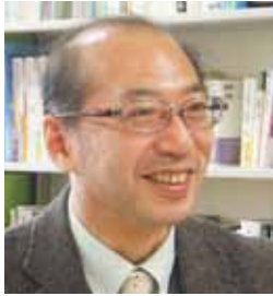
専門職学位課程 教職実践専攻 専攻長