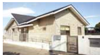
附属特別支援教育臨床研究センター (教職大学院サテライト教室)