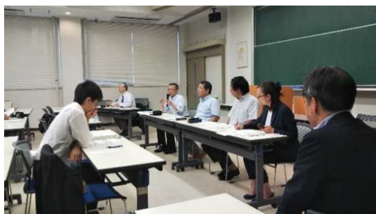
教職大学院授業 ミドルリーダー養成特別演習 「これからの地方教育行政とミドルリーダー」より

そこで、本シンポジウムでは、この間の経過、教育委員会の現状と課題、将来展望について語っていただきます。その上で教育長自身が学び続けることについて、とりわけ大学院・教職大学院で学ぶことの意義や課題について語っていただくとともに、これからの教職大学院の在り方について提言していただきます。