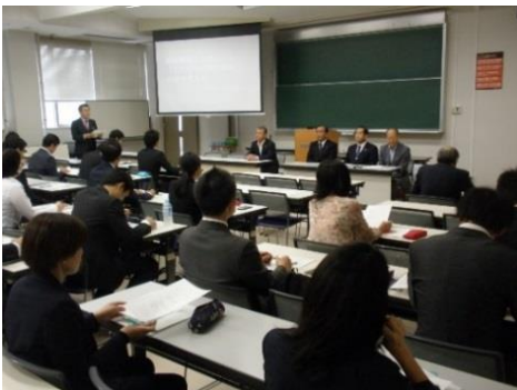
教職大学院授業 ミドルリーダー養成特別演習 「新教育長シンポジウム」より

教員養成と育成を担う教職大学院への期待とその役割について、それぞれの立場から意見を交換します。