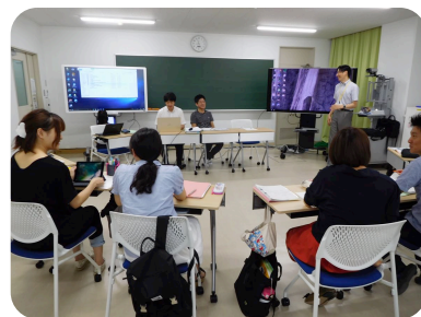
教職大学院の授業風景